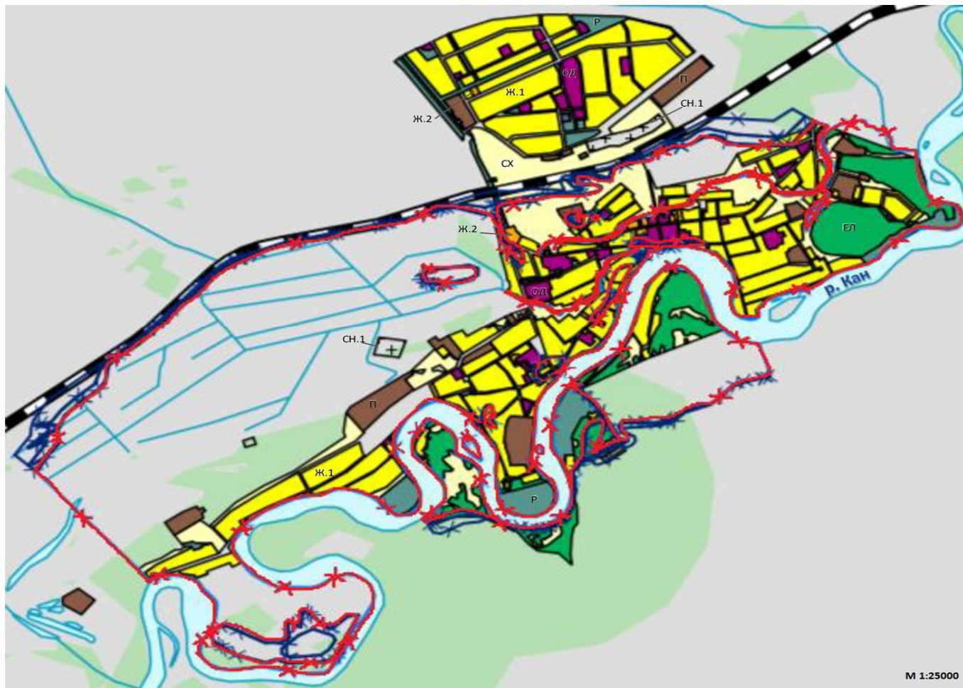
СЕЛО ИРБЕЙСКОЕ ИРБЕЙСКОГО СЕЛЬСОВЕТА Карта зон с особыми условиями использования территории (зоны затопления, подтопления территории)

Приложение 5 к правилам землепользования и застройки муниципального образования Ирбейский сельсовет Ирбейского района Красноярского края