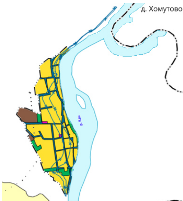
Зона слабого подтопления